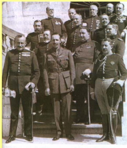
Alfonso XIII y el Directorio militar